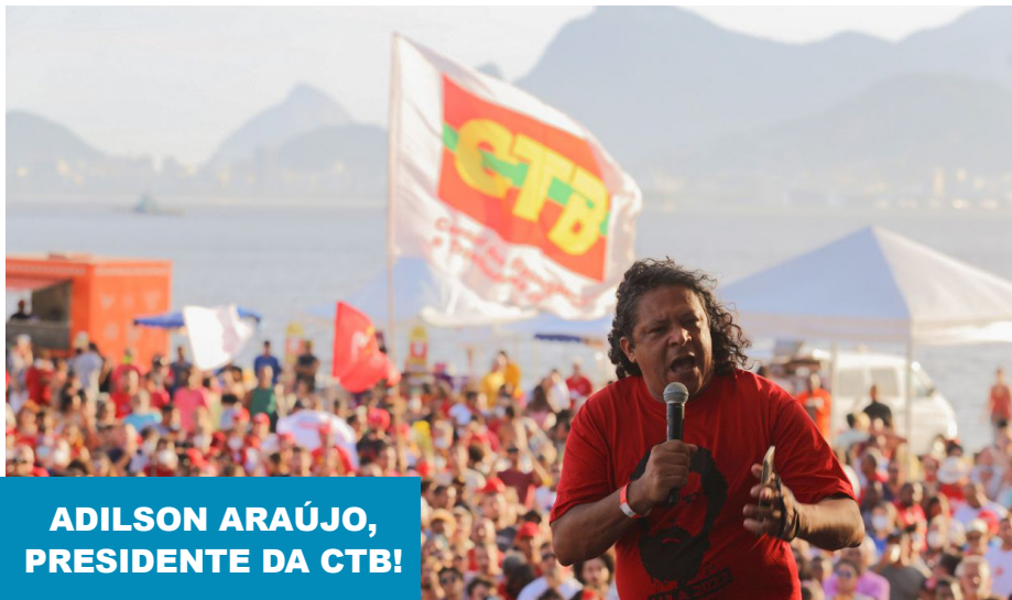
ADILSON ARAÚJO, PRESIDENTE DA CTB!

D urante a abertura do seminário Brasil Pós-Pandemia, Desafios do Projeto Nacional de Desenvolvimento, que foi realizado no dia 23 de Março, no Sindicato dos Comerciários do Rio de Janeiro, o presidente nacional da CTB, Adilson Araújo, ressaltou que as eleições convocadas para outubro deste ano serão decisivas para o futuro da nação e da classe trabalhadora brasileira.